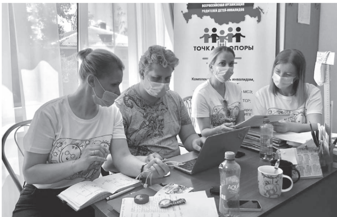
За время работы проекта в 2020-2021 годах помощь получили более 350 семей

– Мы поделимся опытом с врачами, которые там работают. Существует проблема: доктор не всегда владеет документами, которые регламентируют порядок заполнения направляющих документов на медико-социальную экспертизу. Ещё одна проблема – низкая информированность родителей о федеральных и региональных мерах соцподдержки, например о праве любого ребёнка на об-