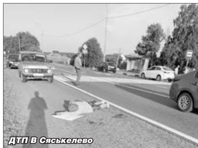
ДТП В Сяськелево

Днем 25 июня в деревне Ознаково 36-летнего мужчину укусила в лицо пчела. Как это нередко случается, у мужчины пошла аллергическая реакция: он потерял сознание, у него начались судороги и рвота. В состоянии аллергического шока его под капельницами до-