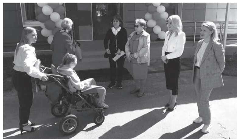
Комфортная жизнь для родственников людей с ограниченными возможностями – один из трендов социальной сферы Ленобласти

Продолжает работу и мобильная приемная соцзащиты, где консультируют жителей о мерах социальной поддержки. С 3 по 29 июня 2022 года такие консультации на местах прошли в Кингисепе, Ивангороде, Усть-Луге и других населённых пунктах Кингисеппского района. Как отмечают специалисты, жители задают немало вопросов, поэтому данная форма работы является эффективной.