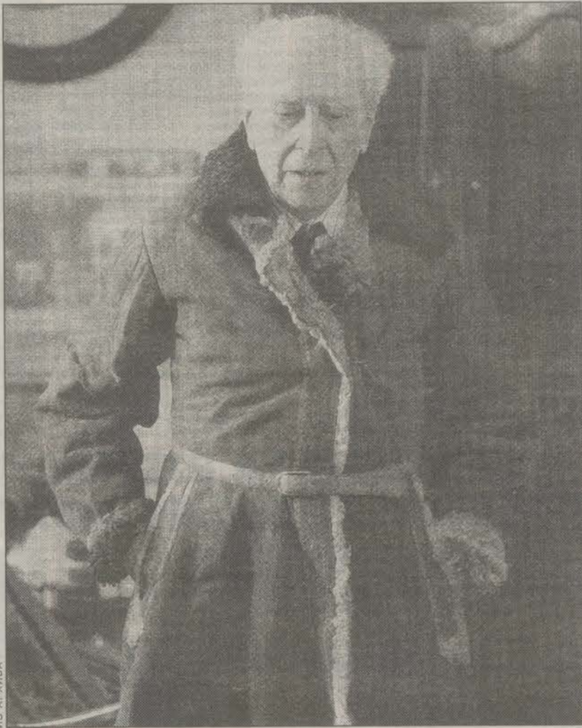
Д.С. Лихачёв в тулупе, сохранившемся у него со дней соловецкого заключения дома, 1991 год.

Впоследствии, в конце семидесятых годов, Дмитрий Сергеевич Лихачев вместе с коллегами из Пушкинского Дома снова посетил Сиверскую. Сентиментальная поездка навевала много воспоминаний... Дом в Старо-Сиверской, окруженный тени-