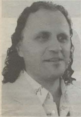
Родился в 1970 году в Гатчине. Эстрадный певец и руководитель молодежной общественной организации «Лига».

Вопрос следующего номера: Как Вы относитесь к тому, что в Красносельском районе Санкт-Петербурга появится китайский квартал? Считаете ли Вы это решение экономически оправданным и просчитанным с точки зрения возможных социальных последствий? *