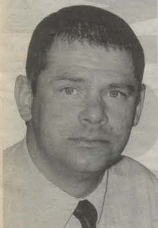
Родился в 1965 году. Закончил Полтавское высшее зенитное командное училище. Генеральный директор ООО «Дуплет».