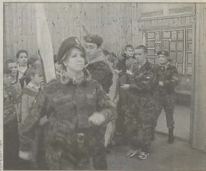
венной, спортивной и т. д.) — учителя ими гордятся, — говорят в школе.

Работа военно-патриотического клуба направлена также на организацию дисциплины в школе, решение разного рода хозяйственных вопросов. Некоторые воспитники из «Неба» помогают в учебе отстающим. В клубе есть командиры, заместители по разным направлениям (учебно-воспитательной, хозяйст-