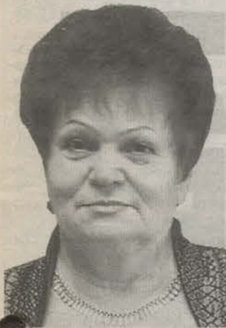
Родилась в Брянской области. Замуженный экономист Российской Федерации.