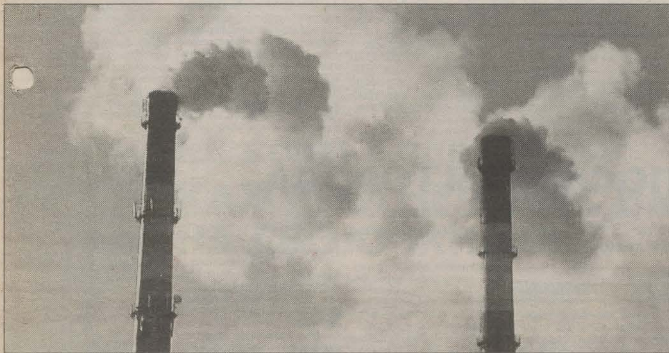
Материал читайте на 2-й стр.