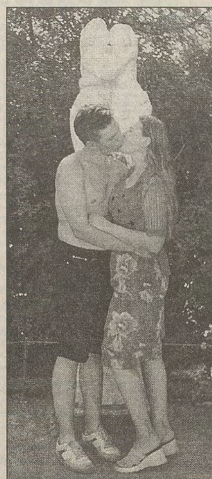
Прислала Г. А. Баранова.

Итоги подведем в Международной женский день — 8 марта. На конкурс принимаются любые фотографии, рассказывающие о чувствах влюбленных, по адресу: пр. 25 Октября, д. 35а, редакция газеты «Гатчина-Инфо». Победителя конкурса ожидает приз.