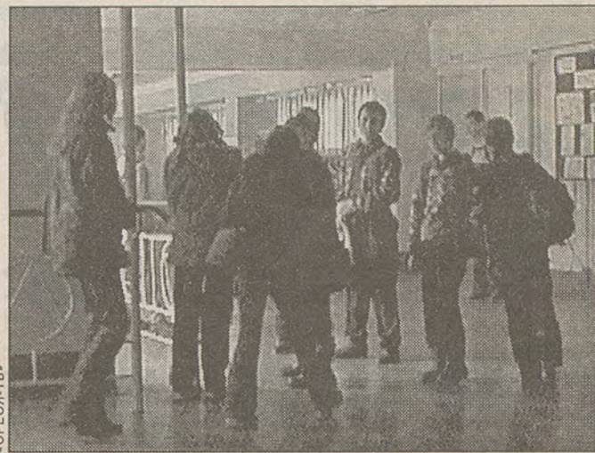
Стенка на стенку?

Чуть больше знают о конфликте те, что помладше задир — 7-8-классники. Но и у них другие интересы. «Кажется, некоторые ребята нашей школы недо-