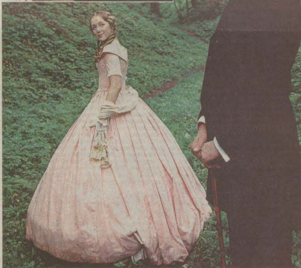
Кадры из кинофильмов «Аз и Ферт» (сверху) и «Дикарка».

Заканчивается подготовка к VIII кинофестивалю «Литература и кино». 23 февраля он начнет свою работу: в 11 часов откроется ретроспективный показ, в 12 часов начнется детский кинораздник «В гостях у Золушки», на который приглашаются все желающие дети и их родители, в 19 часов откроется внеконкурсный показ. 24 февраля в 17.30 состоится торжественное открытие кинофестиваля, а 25 февраля в 10.00 откроется конкурсный показ. Программа всех показов на момент подписания номера в печать в очередной раз дорабатывалась, поэтому на 15-16-й страницах вы найдете анонсы фильмов (подробные — конкурсного и внеконкурсного показов, короткие — остальных показов) и наиболее вероятное время их демонстрации.