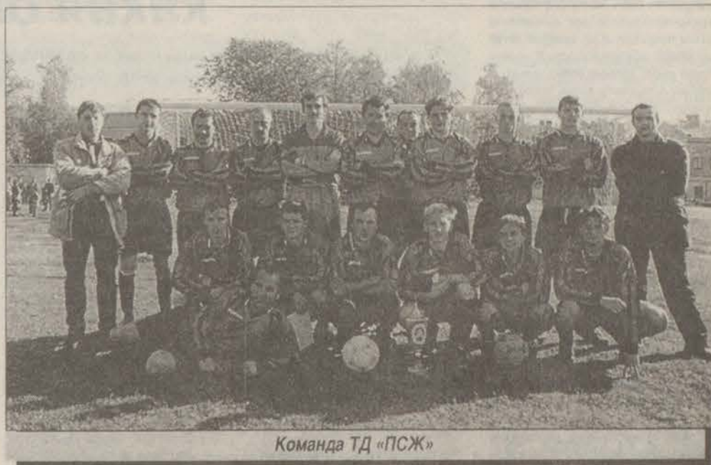
Команда ТД «ПСЖ»