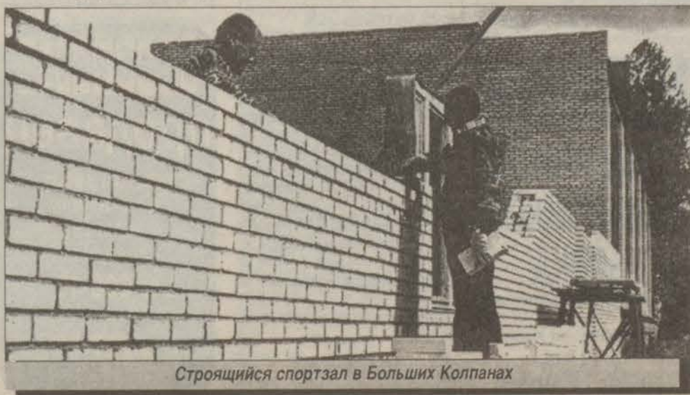
Строющийся спортзал в Больших Колпанах