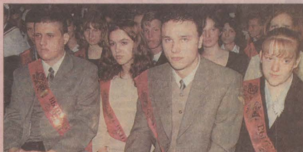
Выражаем благодарность фотолaborатории «КОДАК-экспресс» (пр. 25-го Октября, 59) за помощь в подготовке фоторепортажа.